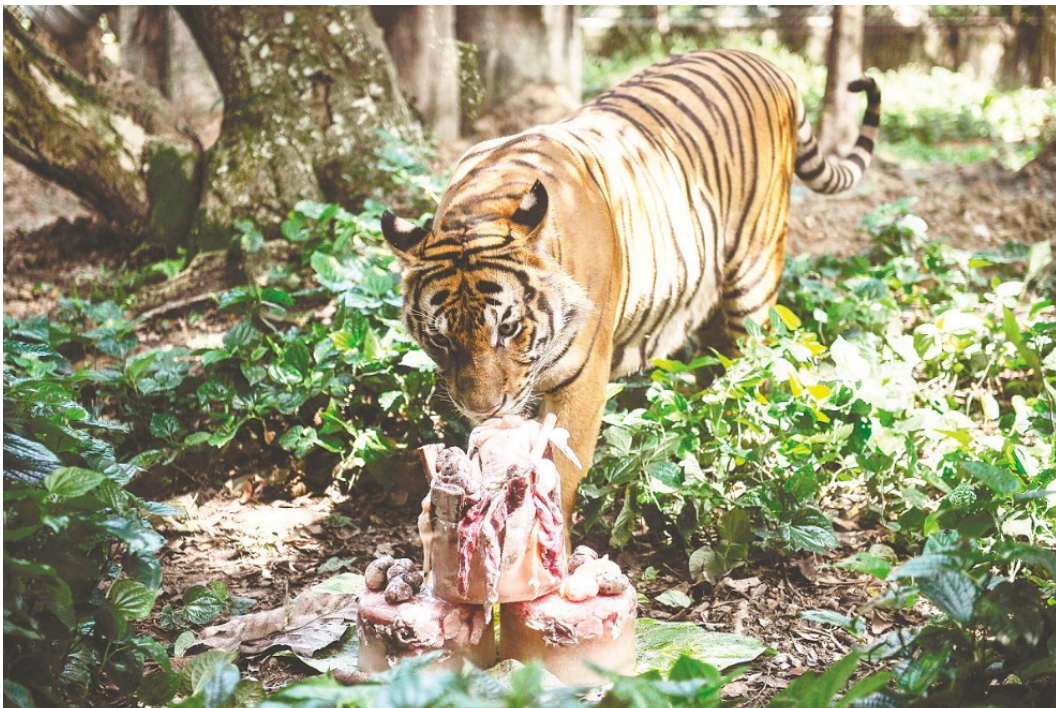
Die Natur nutzt ein System aus Kontrolle und Ausgleich, um Überbevölkerung zu verhindern und die Stabilität des Ökosystems zu gewährleisten. Raubtiere in der Nahrungskette tragen dazu bei, die Beutepopulationen unter Kontrolle zu halten.

JEDES überzählige Kind verstärkt die Auswirkungen des Klimawandels. Diese unangenehme Tatsache kommt nicht gut an, da in der Bevölkerung kaum bekannt ist, dass die Überbevölkerung die Hauptursache der globalen ökologischen Krise ist, die sich in Klimawandel, Artensterben und giftiger Umweltverschmutzung manifestiert.